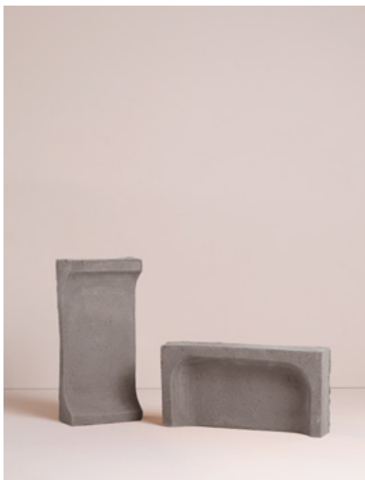
Cotto Grigio 01