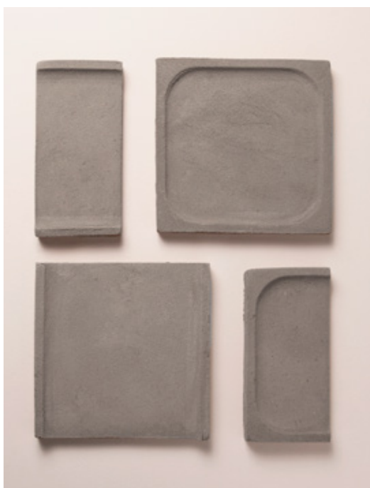
Cotto Grigio 01